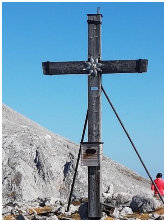
Aufgenommen am Hohen Brett, Gipfelkreuz Hohes Brett