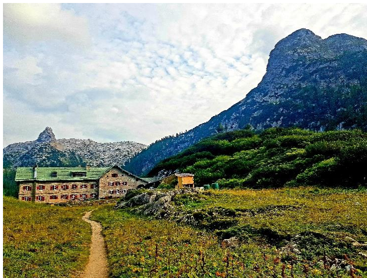
Aufgenommen vorm Kärlingerhaus im Steinernen Meer