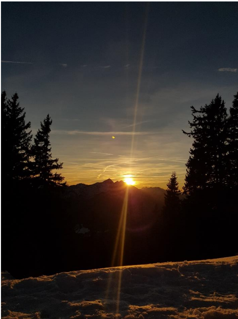
aufgenommen auf der Zwieselalm mit Blick auf Sonntagshorn beim Sonnenuntergang