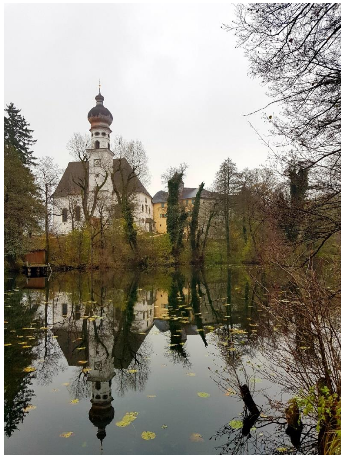
Aufgenommen am Höglwörther See, Höglwörther Kloster