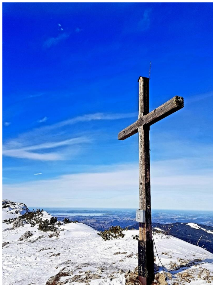
Aufgenommen Gipfelkreuz Zwiesel, mit Blick auf Chiemsee