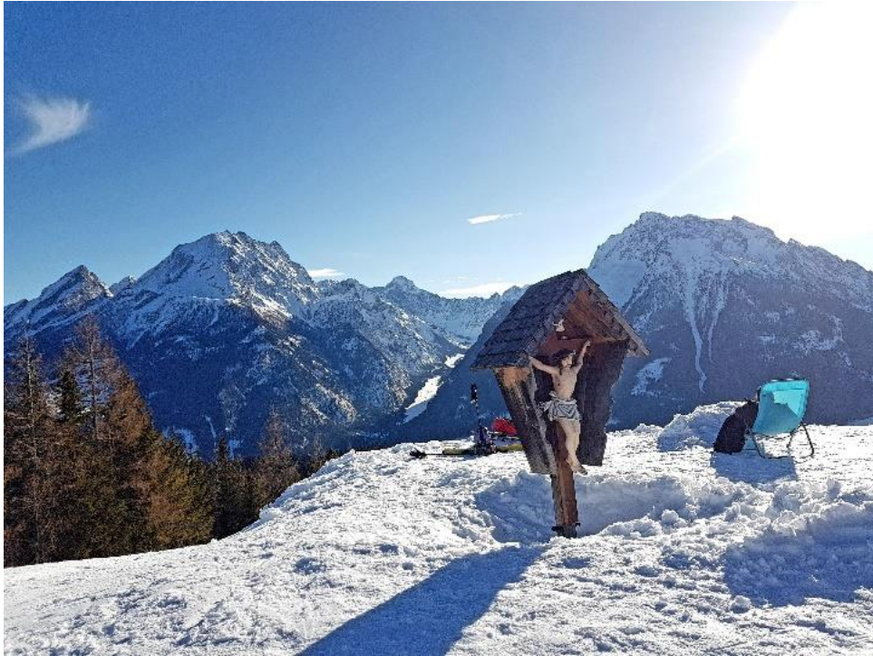
Aufgenommen das Gipfelkreuz Berggaststätte Hirschkaser, mit Blick auf links Watzmann und rechts Hochkalter