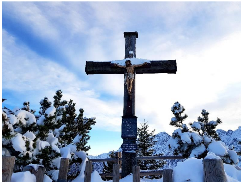
Aufgenommen Gipfelkreuz am Rossfeld