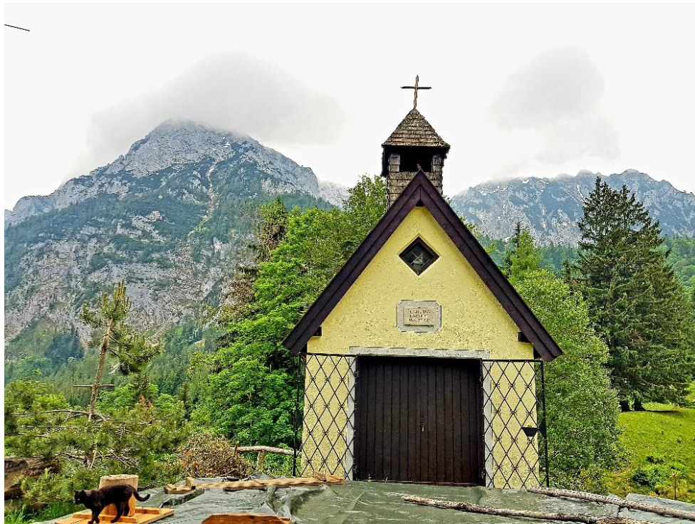
Kapelle auf da Stoana Alm mit Blick auf links Hochstaufen und rechts Mittelstaufen