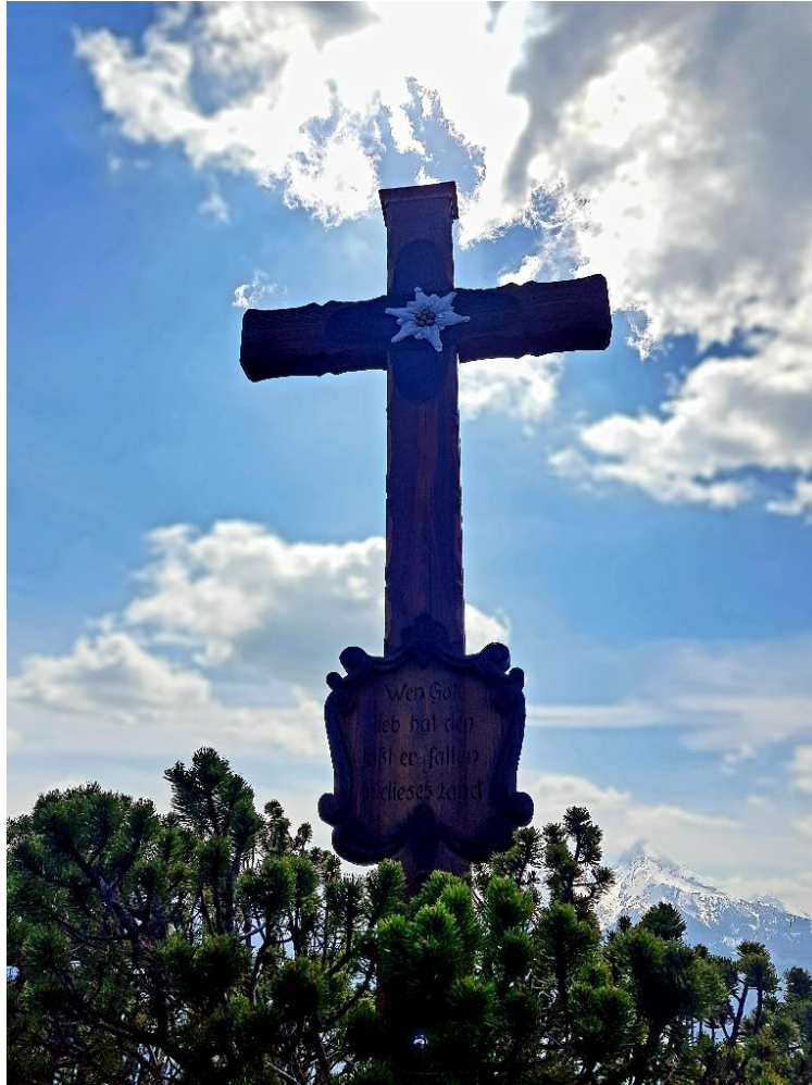
Aufgenommen auf der Paulshütte, Kneifelspitze mit dem legendären Zitat von Ludwig Ganghofer