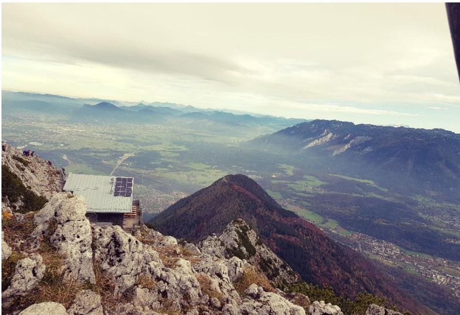
Aufgenommen auf dem Hochstaufen, mit Blick links auf das Reichenhaller Haus, mittig der bewaldete Fuderheuberg und rechts Untersberg