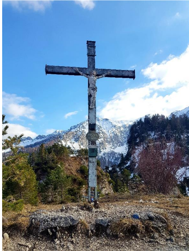
Aufgenommen das Gipfelkreuz am Dötzenkopf, Bad Reichenhall