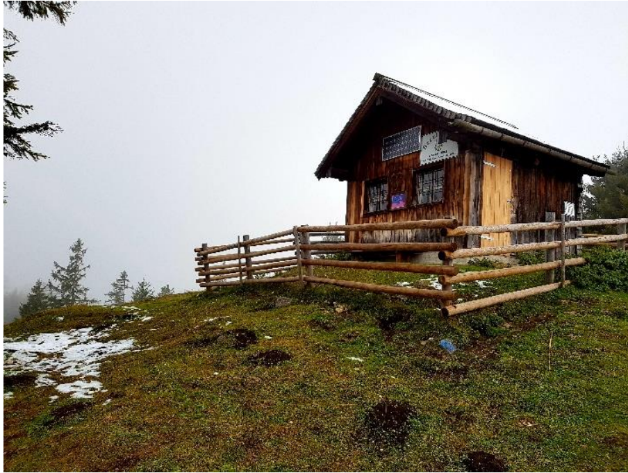
Aufgenommen Bezoldhütte am Toten Mann