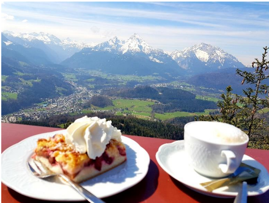
Aufgenommen auf der Kneifelspitze mit Blick auf mittig Watzmann und rechts Hochkalter