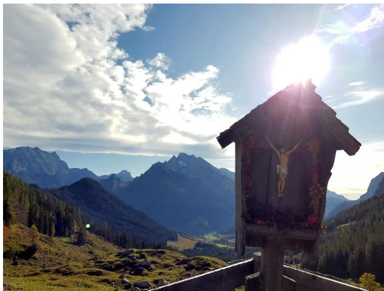
Aufgenommen auf der Mordaualm mit links Blick auf Watzmann und mittig Hochkalter