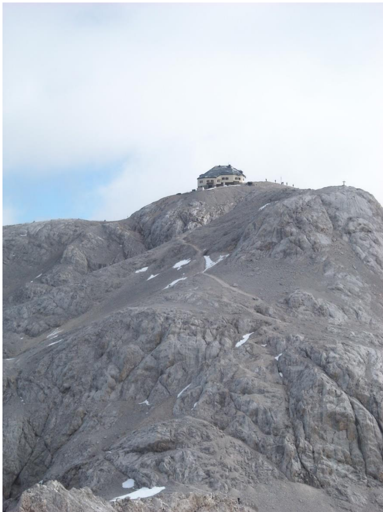
Matrashaus am Hochkönig