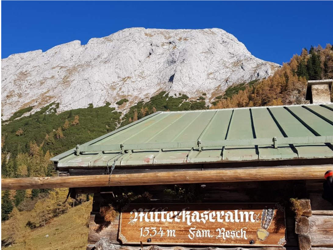
Aufgenommen an der Mitterkaseralm am Jenner mit Blick auf das Hohe Brett