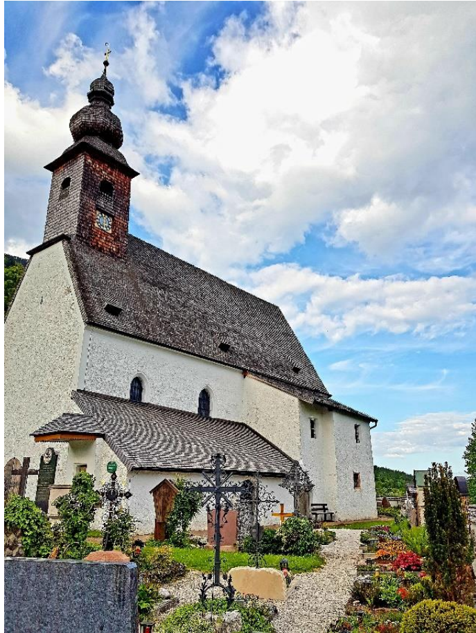
Aufgenommen am Nonner Kircherl im Nonner Oberland