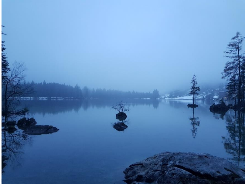
Aufgenommen am Hintersee