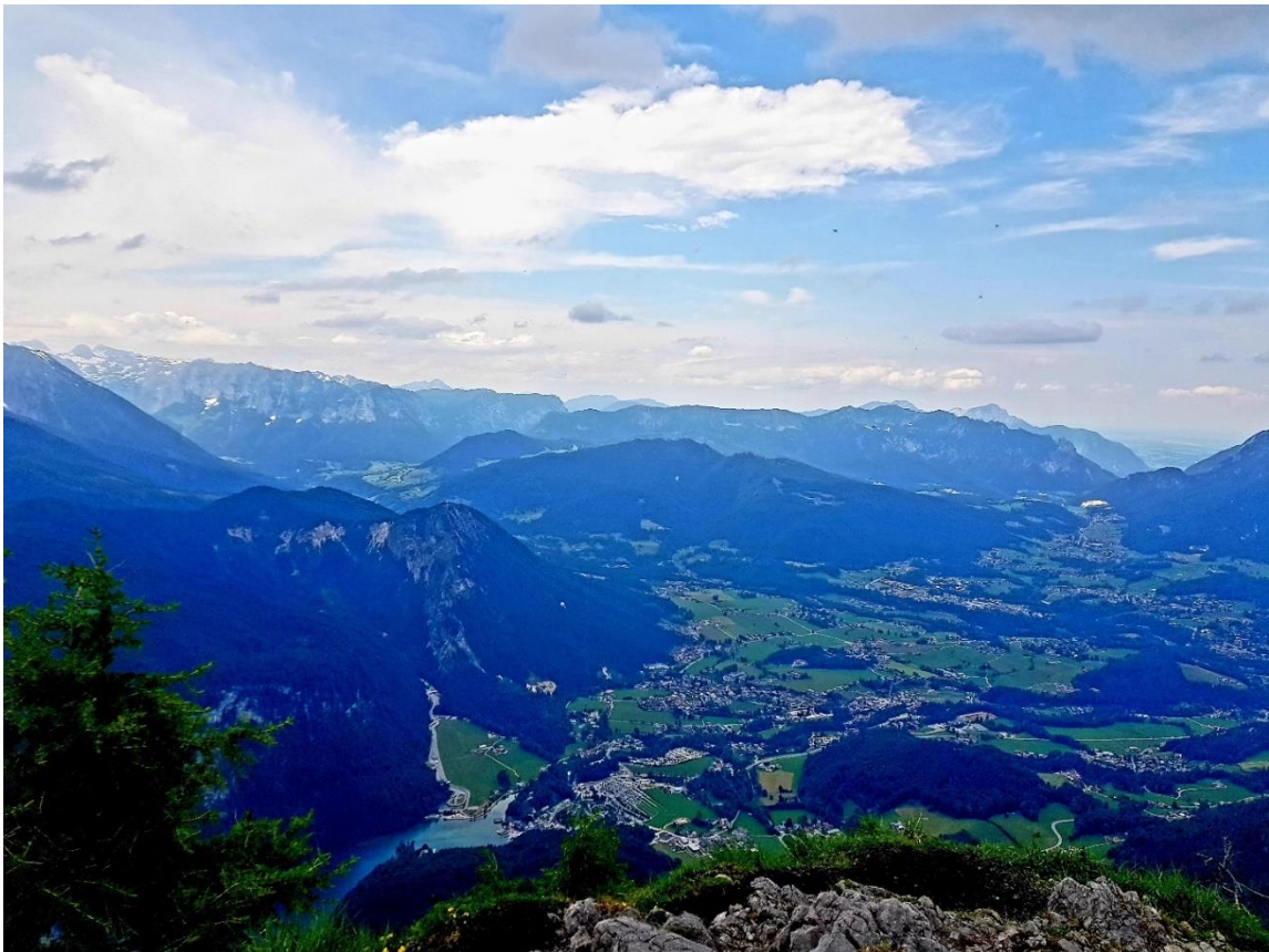
Aufgenommen auf dem Jenner, mit Blick auf Königssee mit Blick auf links Grünstein, mittig Toter Mann/Götschen/ Kneifelspitze, hinten rechts Lattengebirge, hinten links Reiteralpe