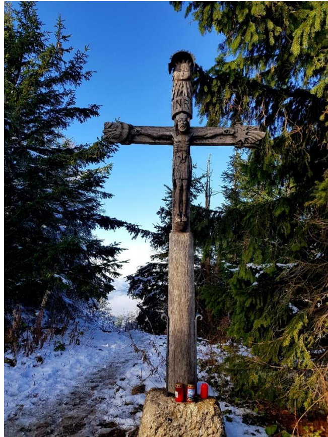
Aufgenommen am Gipfelkreuz Teisenberg, oberhalb der Stoisser Alm