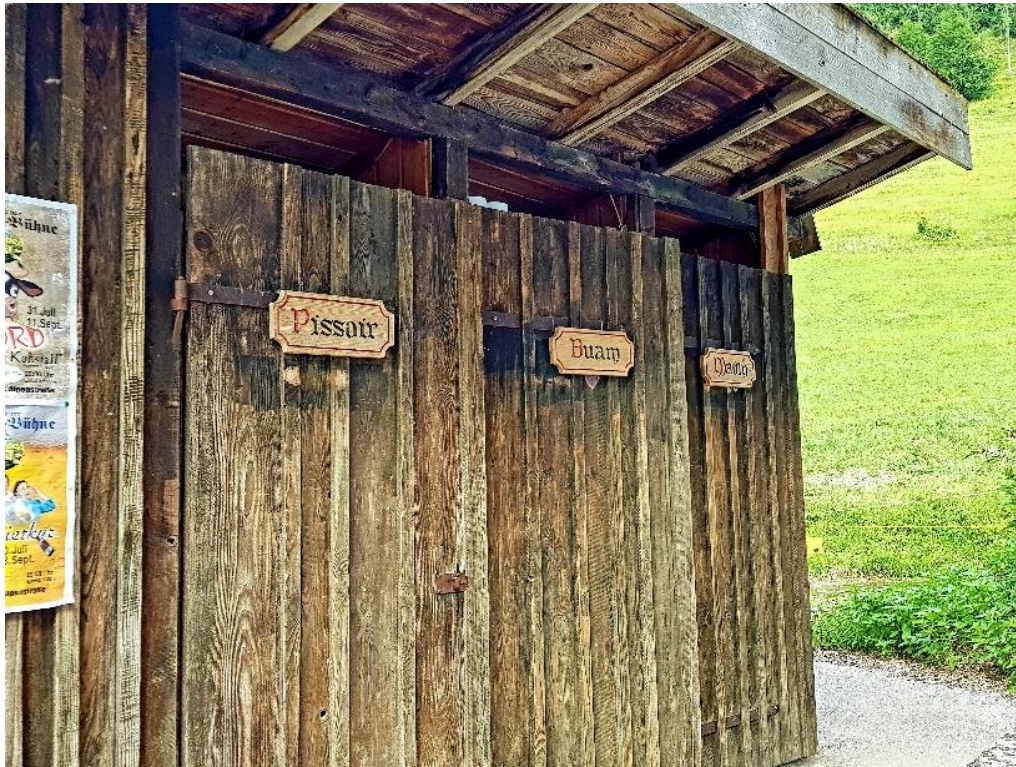
Aufgenommen auf der Höllnbachalm - Toiletten