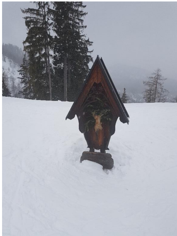
Aufgenommen am Gipfelkreuz am Götschenkopf, Bischofswiesen