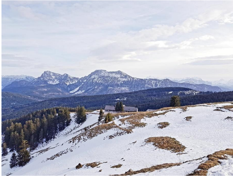
Aufgenommen auf dem Teisenberg mit Blick auf Stoisseralm, links hinten Staufen, rechts Zwiesel