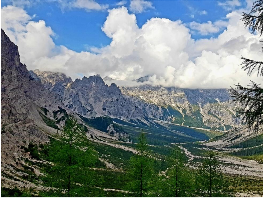
Aufgenommen am Wimbachgries