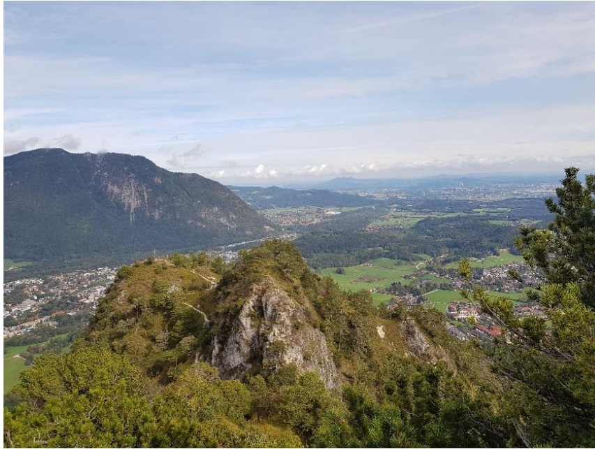
Aufgenommen am Spechtenkopf mit Blick auf im Vordergrund Dötzenkopf im Hintergrund Fuderheuberg