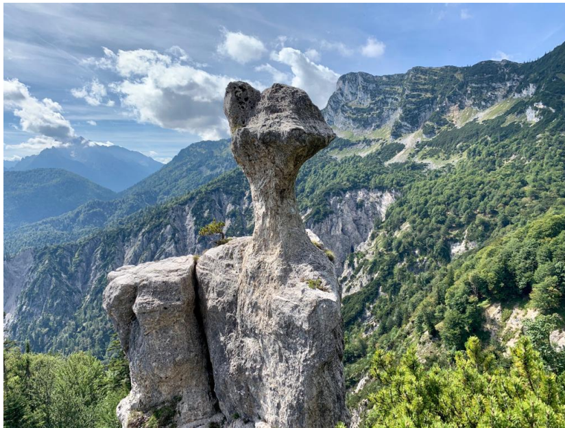
Aufgenommen auf der Steinernen Agnes